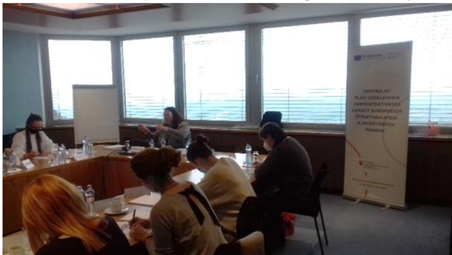
Vzdelávacia aktivita „Prezentačné zručnosti“, Hotel Bôrik 19.10.2021