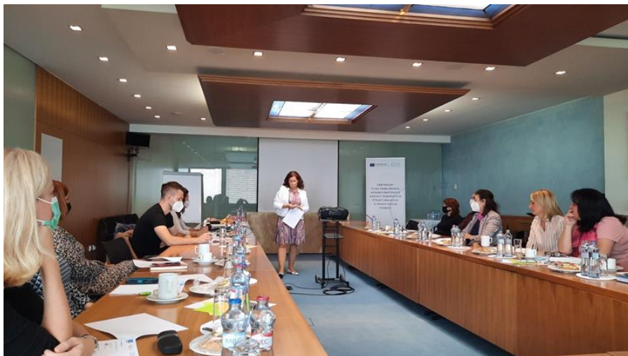
Vzdelávacia aktivita „Informačné a komunikačné opatrenia a nástroje“, Hotel Bôrik 11.10.2021