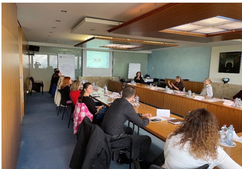
Vzdelávacia aktivita „Politika súdržnosti EÚ a Partnerská dohoda pre PO 2021 - 2027“, Hotel Bôrik 02.12.2022