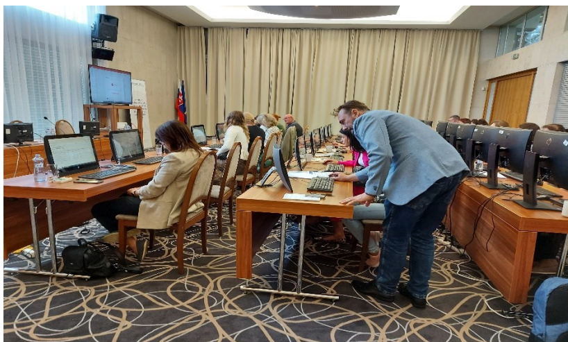
Vzdelávacia aktivita „Prezentačné zručnosti – neverbálna komunikácia“, Hotel Bôrik 29.09.2022